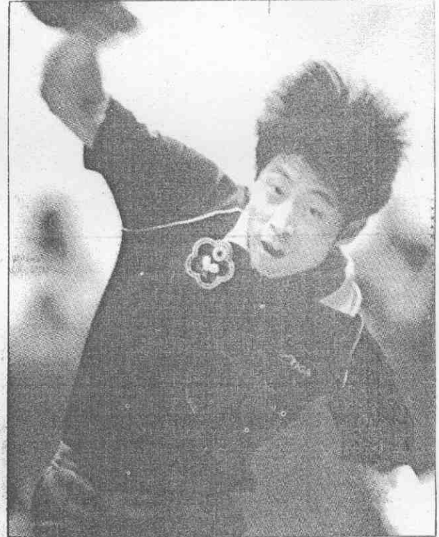
▲ 世界桌球賽個人賽人賽，中華隊文堂謝在男子單打資格賽中勝獲中賽。