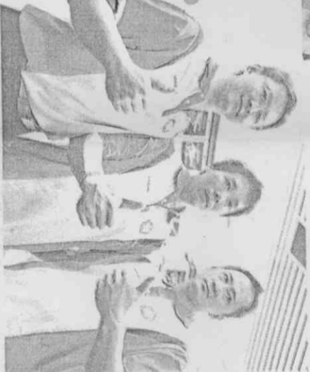
聽奧保齡球女子五人團體組我國奪下金牌，賽後隊友們相互擊掌道賀。(記者王藝松攝)

緊接著進行的五人團體賽，前3局打完僅領先不到百分的台灣隊，在隊友的團隊戰力發揮下，穩定拉開差距，以聽奧保齡球男子三人組，台灣隊以兩分之差飲恨吞銀。(記者王藝松攝)