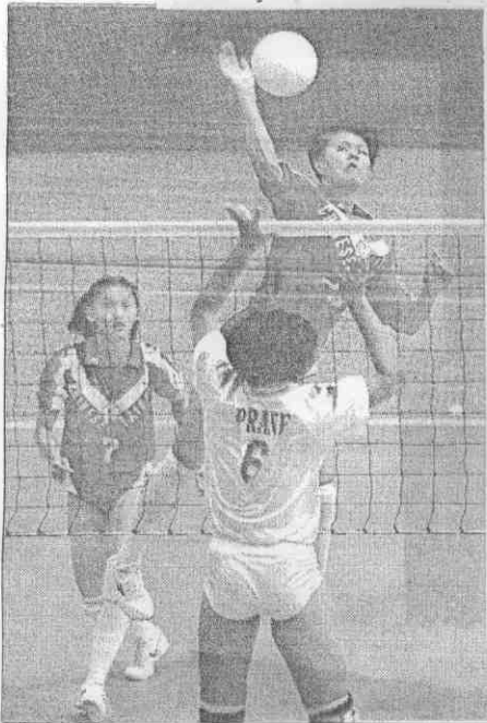
←中華女排大砲手許春蓮(右)跳躍殺球，威力無比。