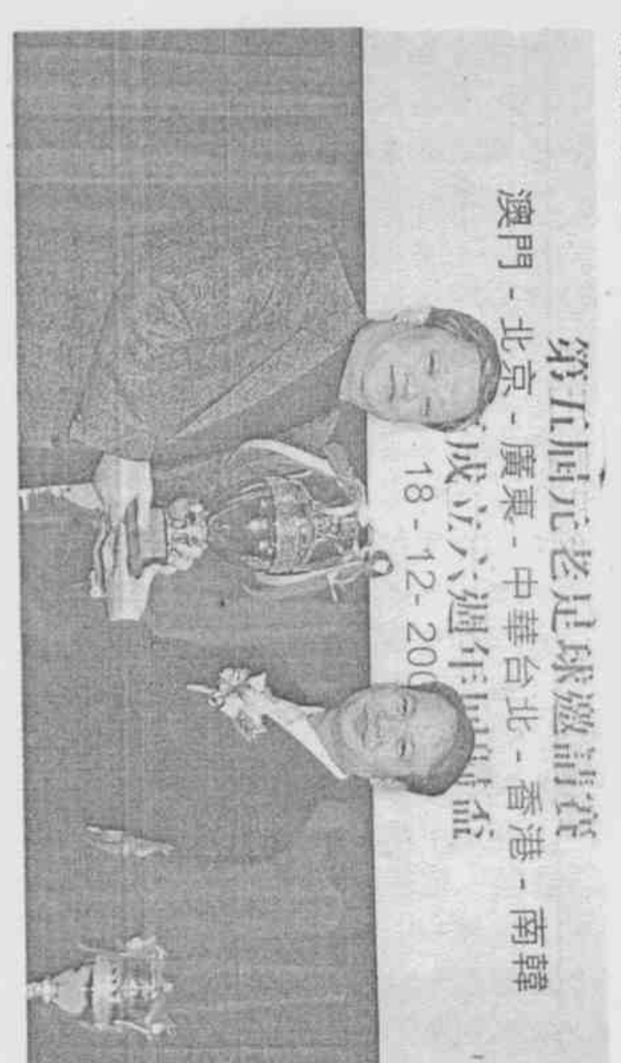
第五屆元老足球邀請賽 澳門 - 北京 - 廣東 - 中華台北 - 香港 - 南韓 成立六週年紀念 18-12-200