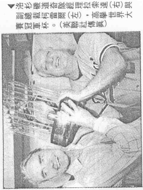
洛杉磯道奇隊經理拉索達(右)與副總裁柯雷爾(左)，高舉世界大賽冠軍杯。

【本報綜合報導】棒球界中贏球場數最多的球隊，隊中強打如雲，本季全壘打總數是一三三支。而道奇隊四名主將受傷，上場的球員本季打擊總數是卅六支。因此，賽前一般看好運動家隊。 不料，道奇隊在柯西瑟帶領下，成功地