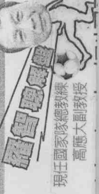
現任國家隊總教練 高應大前教授