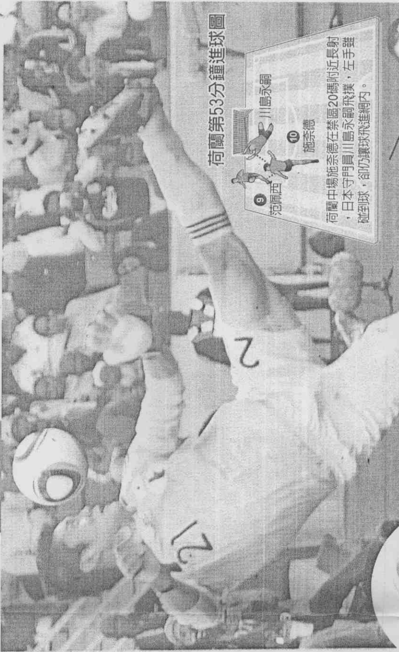
荷蘭第53分鐘進球圖