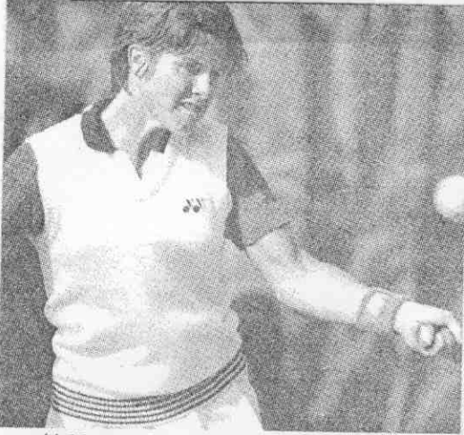
· 健穩球抽拍正，特斯爾貝的拍執手左▲ (片照料資報本) 。娜胡戰出將天今

曾經高居世界排名第四的貝爾斯特 (Dianne Fromholtz Balestrat)，也在昨天中午翩然飛抵台北，今天加入國際女網賽戰陣，將與胡娜交手。 貝爾斯特的名字容或陌生，這是在一九八三年結婚後冠上的夫姓，以前她以佛羅霍茲本名南征北討，在國際女網赫赫有名，算得上是一號響叮噠的人物。在她的網球生涯中，她曾經四度擊敗「女金剛」娜拉提諾娃，三度打贏艾芙特，與金恩夫人交戰紀錄是八勝六負；在溫布頓、法國、美國等大賽都打過前四名，並代表澳洲從一九七九到八三年，打了五屆聯邦杯。 八三年貝爾斯特結婚後高掛球拍，原擬退休；但是十五個月後東山再起，並且如一頭醒獅般讓大家看得驚訝不已，她快速地從平淡轉向絢爛的過程成為網球佳話。 這一年已經廿八歲的貝爾斯特沒有世界排名，靠賽會給予兩次「外卡」，以及多次從會外賽辛辛苦苦打進會內賽，年終排名擠進一〇一名；這項傳奇性復出使她成為年度「復出獎」(Come Back)得主。八六年及八七年年排名都是廿一。 貝爾斯特秀麗大方，以左手執拍，身高一六二公分，球場上風姿卓越，七十年代經常受邀請到日本參加表演賽，安琪兒、網球美人……等綽號不勝枚舉；一九八一年她獲國際女網委員會選為「最佳風度獎」得主。她的全盛時期從一九七五年開始延續到八〇年，排名幾乎都在十名內；七九年三月更攀登到世界第四，但是後來由於一次車禍，成績受影響，八三年退出網壇。 八六年貝爾斯特在溫布頓打進第四回合，再度引起大家注目，這位讓人懷念的澳洲網球美人是否會再爆冷門，成為當時熱門話題。 這次貝爾斯特由吳岱勳特別推薦來華，第一場球就與胡娜單打對壘，一中一外，兩位都是網球美人，除了看球技，喜歡賞美的球友應該還有別的收穫。