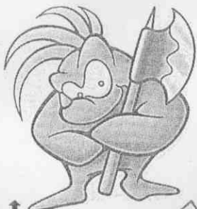
↑ LUKA 魯卡 （勇士隊）