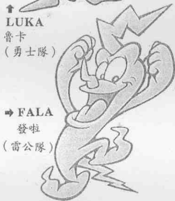
→ FALA 發啦 （雷公隊）