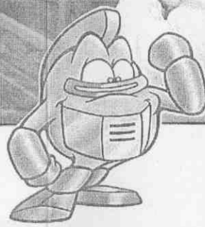
↑ AGAN 阿剛（金剛隊）