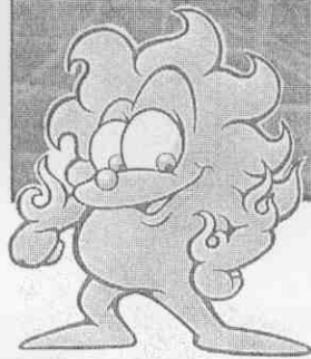
↑ GIDA 吉大（太陽隊）