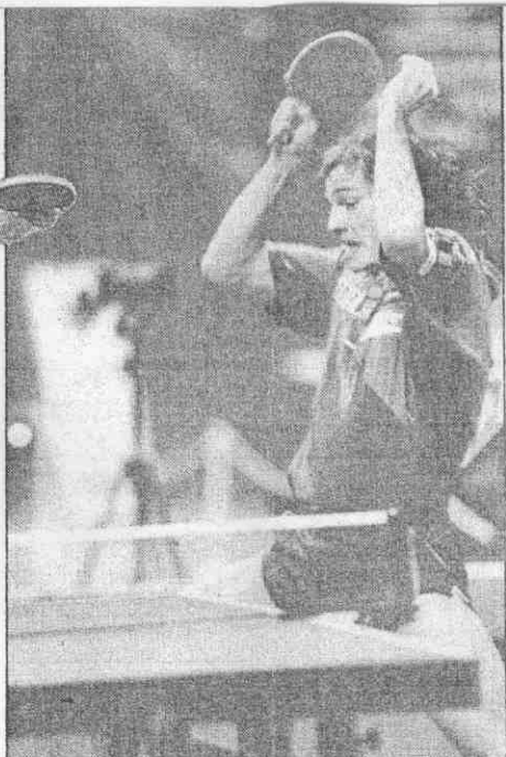
↑世界排名第一的比利時塞夫擊敗大陸孔令輝。