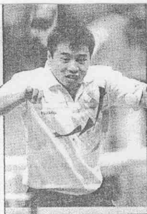
↑世界排名第二的大陸桌球好手王濤，昨天下午輕鬆的擊敗澳洲的藍格立。