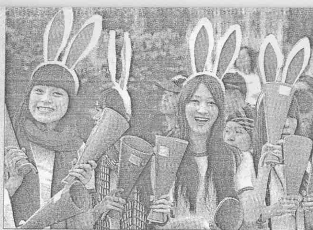
▲啦啦隊以兔女郎造型為民眾加油。(方濬哲攝)

▲「2010富邦台北馬拉松」19日舉行，超過10萬民眾熱情響應，迎著初升的陽光向終點邁進。(方濬哲攝)