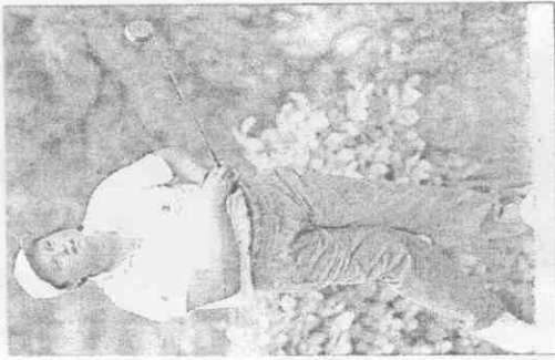
嚴慶明在第六洞打出一桿進洞。