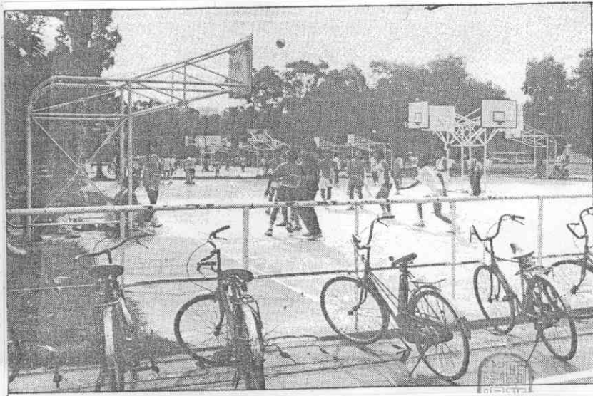
國內最大的「鬥牛場」台大籃球場，每天清晨、午後鬥牛士人潮不斷，還得排班才輪得到上場，很多國手也喜歡到此「鬥一鬥」。