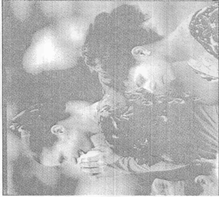
▲湯瑪絲(右)領獎，特薇(左)常非得獎。

【美聯社卡加立二十八日電】東德冰后薇特於十七日晚間以完美的演出，蟬聯冬季奧運會女子花式滑冰金牌，加拿大選手曼蒂也獲銀牌，原先奪得呼聲也很高的美國選手湯瑪絲由於失誤只得到銅牌。