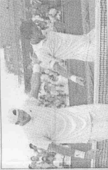
終於贏了！經過十一小時又五分鐘，伊斯納終於破發拿下比賽，他興奮的丟掉球拍，全場都見證歷史。(路透) 好累又輸！法國的馬惠(右)落敗後摸摸臉懊惱。對手伊斯納只能拍拍他以示安慰。(路透)