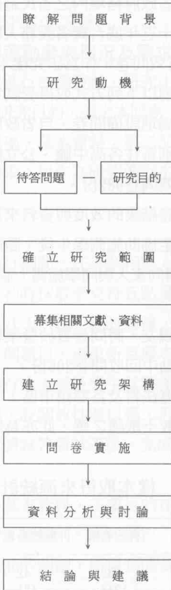
圖 3-2 研究程序流程圖