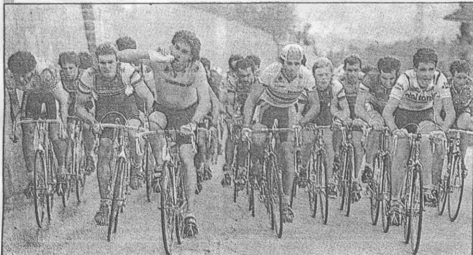
↑ 力脚的手選車由自驗考能最段路坡爬的賽大義環

此外，義大利人為自己選手護航也是花招百出，他們會排成人牆把選手推上坡，派直升機吹風幫選手加速，配合選手優點改變原有路段等等，不一而足，其目的就是为了贏得比賽。 但義大利人風靡自由車賽也很令人感動，每站比賽電視及廣播都從頭實況轉播。媒體更天天以巨幅報導，比賽期間儼然成了義大利的自由車假期。（本報記者 李炎權）