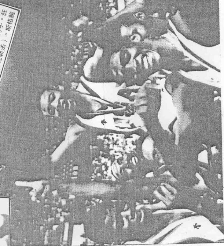
世得奪，隊聯蘇敗擊日廿隊國美若喜欣隊全，軍冠賽標球籃杯界是的上層在揮友隊披杯獎持手。(真傳社新法)。斯格鮑

二十日比賽，蘇聯始終落後，全場未能把比數拉進兩分內，歐巴賀夫賽後說：「奇蹟不會二度重演。」他所指的是蘇聯在準決賽延長賽中九十一比九十險勝南斯拉夫一事。歐森則說：「我們一點也未緊張，上半場依照原定計畫打，嚴密的防守使蘇聯雙手難以發揮。」