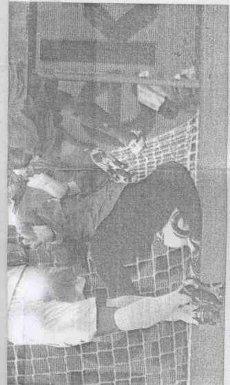
▲葡萄牙隊以7比0大勝北韓，連帶拉抬了小組賽第二輪的進球數。

預賽首戰智利力克宏都拉斯，就傳勝過48年智利，當天聖地牙哥就有數萬名群眾在街頭慶祝，最後引發暴動，警方出動鎮壓才得平息。21日智利贏了瑞士，在世界盃2連勝，晉級機會大增，又有數萬名慶祝勝利和喜悅的球迷來到市中心的廣場，把廣場擠得水洩不通，揮舞