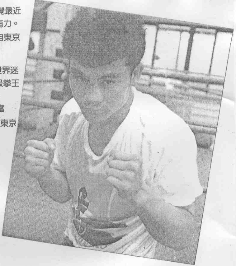
← 現任世界迷你輕丁級拳王羅倍斯。 黃承富／寄自東京