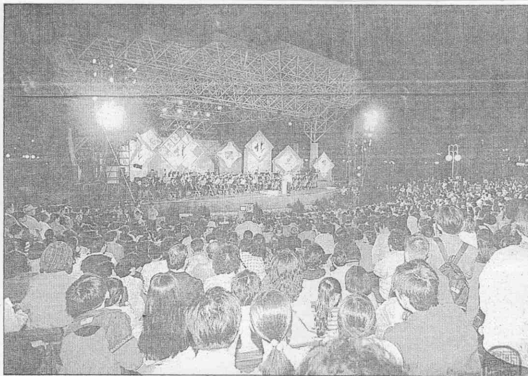
◀昨晚在台北市大安森林公園音樂台，舉行區運之夜。

今天下午開幕前，籌備會將先為主場地前舉行各單位升旗儀式，宣告二十五支代表隊全部進駐及參賽。