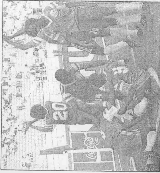
↑喀麥隆前鋒米拉14日出戰羅馬尼亞之役時，個人獨進2球後，受到隊友熱情道賀。