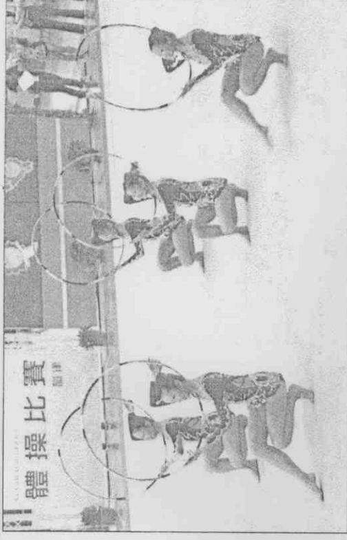
台中市韻律體操隊參加團體組比賽，榮獲亞軍。