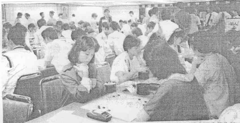
（攝光海楊者記報本）。目注人引最組子女人個，行舉天昨，賽棋專大國全杯生新△

但以強制性的方式，卻未免小題大作。 就主辦單位而言，亦可採用淘汰制，以減輕賽務的負擔，祇是淘汰制稍顯不公平，又無法使比賽的棋友盡興，對主辦單位來說，實在是難於抉擇。 其實，類似這種困擾，在橋藝比賽也曾遭遇過，所以橋藝比賽主辦單位採取的方式，是在被淘汰的隊伍中，另舉辦落選賽，同樣是有獎勵，這種方式，就可彌補成績不好的棋友，不繼續比賽的遺憾，效果很好。棋賽主辦單位不妨可採用嘗試，以增加棋友比賽的意願。 本報記者 林英 誌