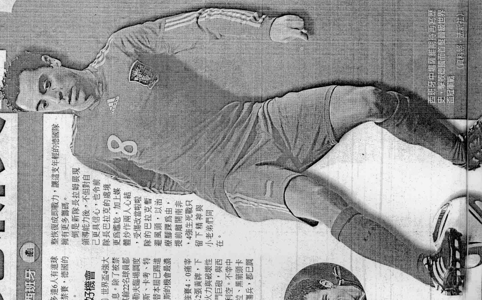
西班牙中場薩維維期待再寫歷史，擊敗德國而首度晉級世界盃冠軍戰。