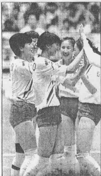
↑遼寧隊奪得全運女排賽冠軍後，球員互相擊掌祝賀。