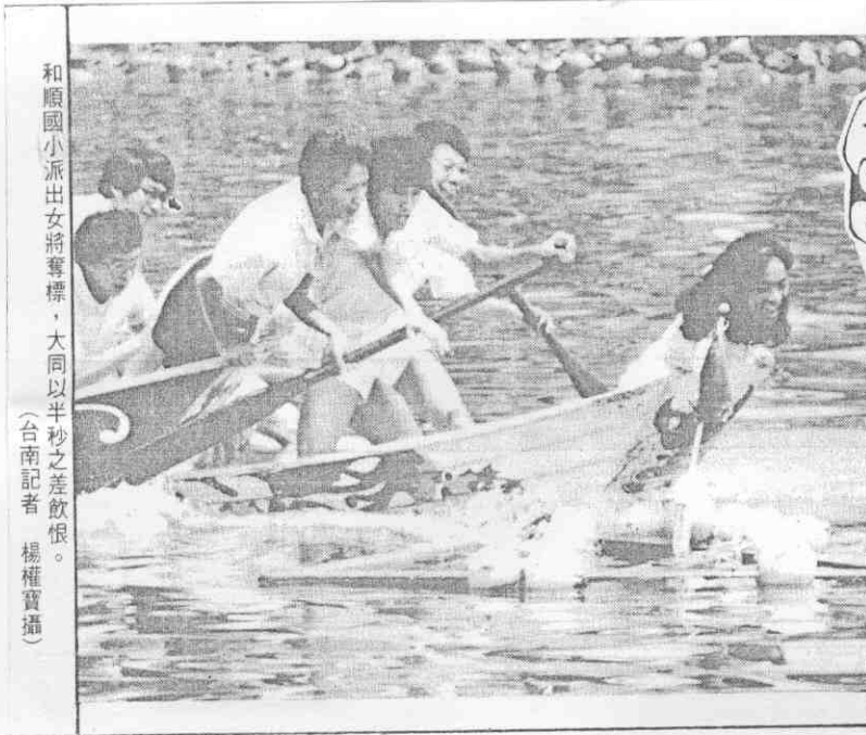
和順國小派出女將奪標，大同以半秒之差飲恨。

今最後決戰從上午八時卅分開火，下午四時閉幕，司令台後全日安排有模型飛機表演、泳裝表演、卡拉OK歌唱決賽，場面將很盛大。