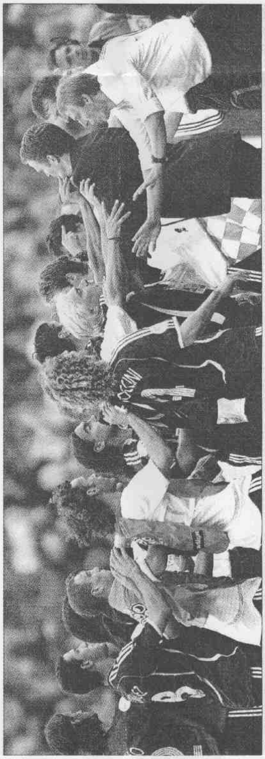
德阿PK戰決出勝負後，雙方球員在場上起了衝突，連德國教頭克林斯曼（右）都上前拉架。

由於德國隊在台北時間七月五日要出戰義大利，調查必須在這個日期前完成，國際足總官員西格說：「此事有其急迫性。」也就是說，如果德國隊員被認為有介入衝突事件的不當行為，可能會受禁賽處分，對德國隊可不是什麼好消息。