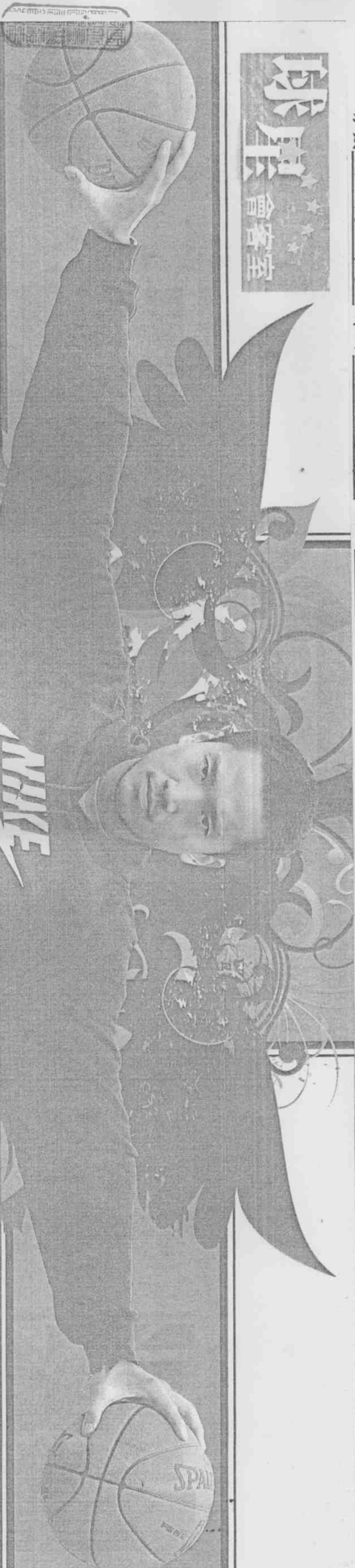
專題報導/文：記者龍柏安 圖：記者林正堃