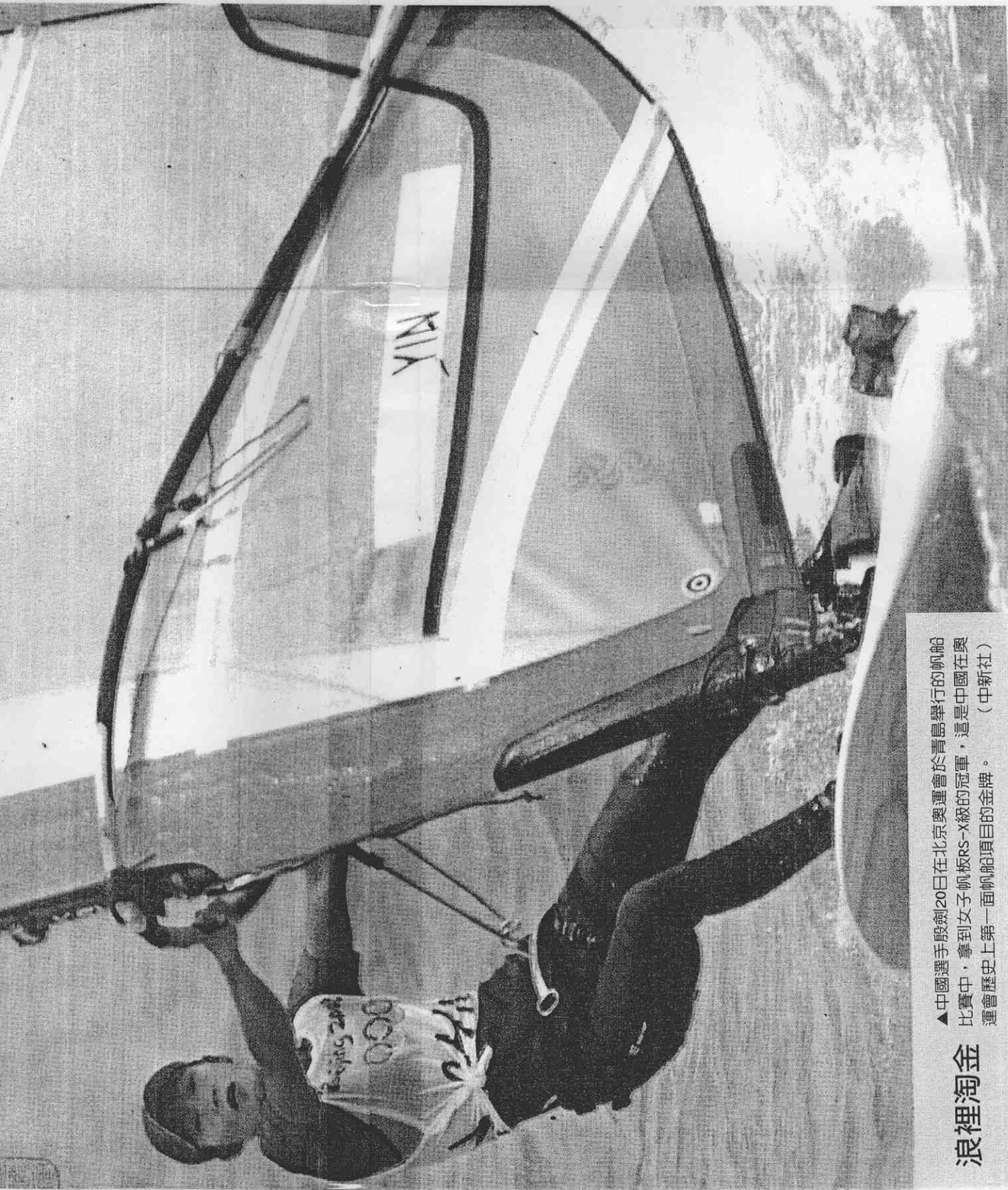
▲中國選手殷劍20日在北京奧運會於青島舉行的帆船比賽中，拿到女子帆板RS-X級的冠軍，這是中國在奧運會歷史上第一面帆船項目的金牌。