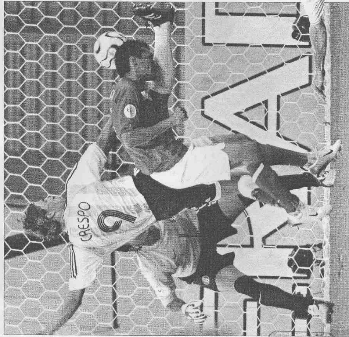
▲阿根廷前鋒克瑞斯波(中)亂軍中踹進一球，扳平情勢。 ▼墨西哥門將山契斯飛身撲救不及，這一球讓墨西哥德國世界杯之路，畫下句點。