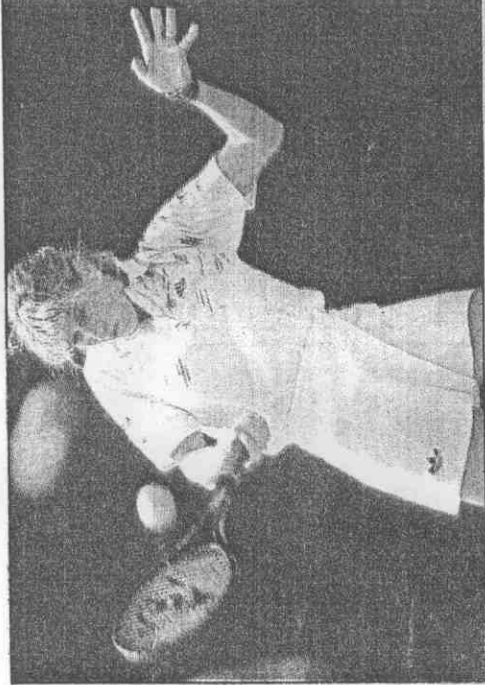
← 德國葛拉芙的女網金牌十拿九穩。

德國田徑的德瑞絲勒跳遠金牌、葛拉芙網球金牌都是十拿九穩；另外在輕艇、划船、馬術、游泳也都可奪金，總金牌也在卅面以上。