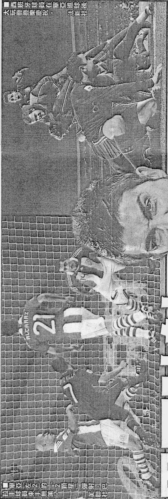
■西班牙球員在畢亞進球後，大玩疊疊樂慶祝。