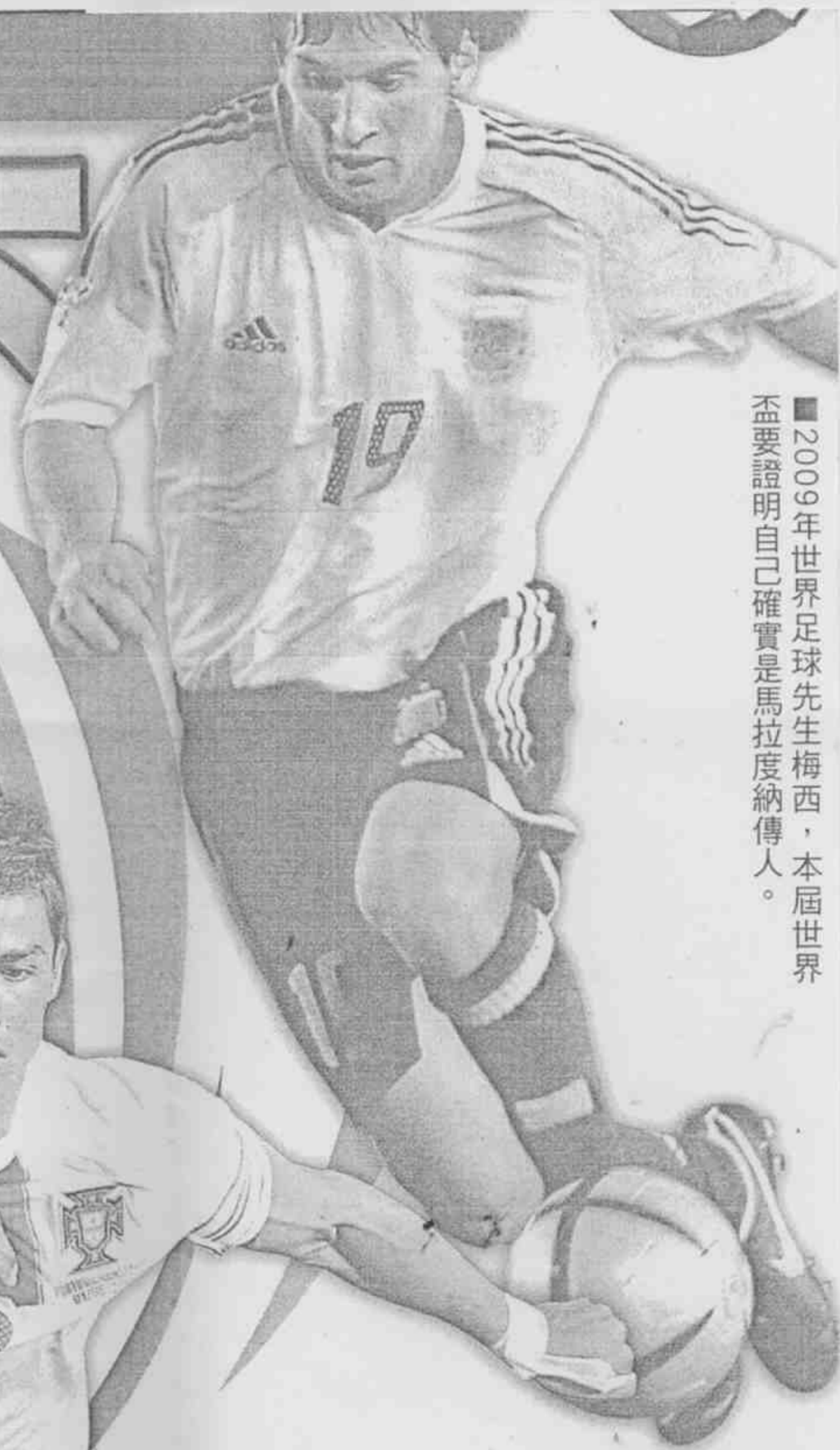
■2009年世界盃足球先生梅西，本屆世界盃要證明自己確實是馬拉度納傳人。