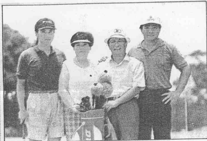
。佑天王與太太王、展永王、俊王起右 ↑