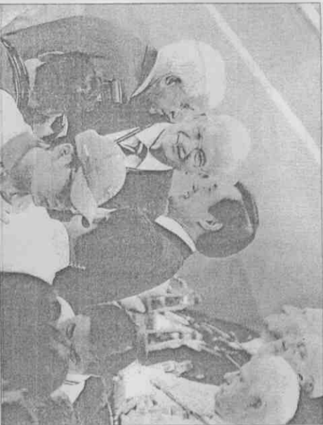
▲總統馬英九（中右）16日出席2009高雄世運開幕典禮，與國際世界運動總會會長朗佛契（中左）等來賓交換意見。

朗佛契在致詞完後邀請馬英九總統上台，而馬英九隨即以總統身分宣告「高雄世運會開始」，在中華奧會歌曲音樂陪伴下，為期十天賽程的賽程正式登場。