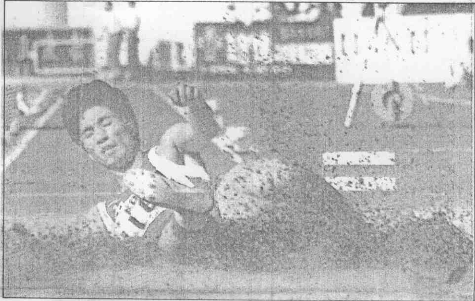
↑大陸跳遠選手陳尊榮，1日在亞運男子跳遠決賽，奮力躍出贏得金牌。

屬於「速度型」跳法的賴正全，個人100m速度可快達10秒51，來北京之前，他也曾在台北跑出10秒59佳績，昨天在場地頂著逆風的情況