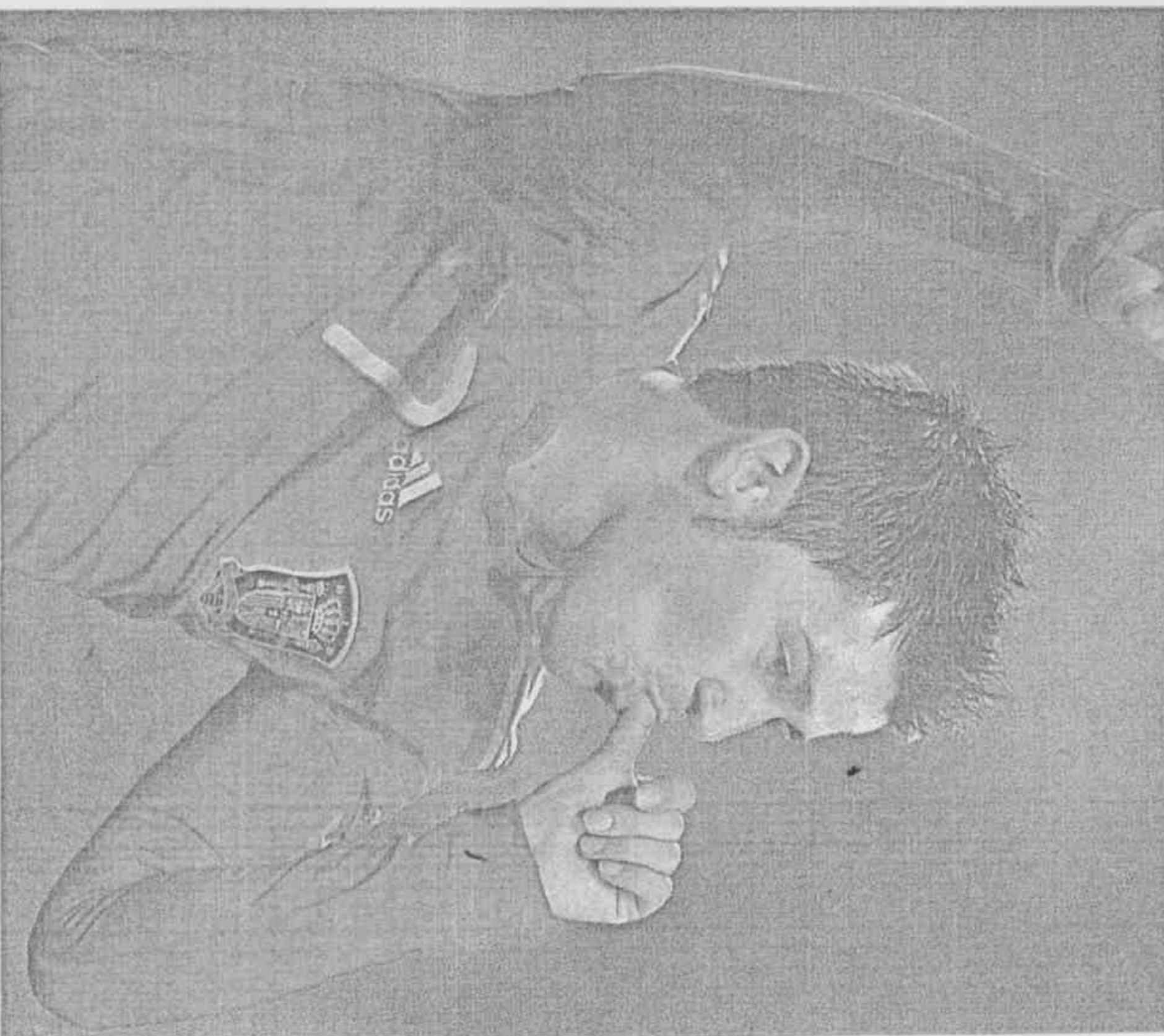
▲西班牙的比利亞目前是賭盤盤口上最被看好的金靴獎得主。