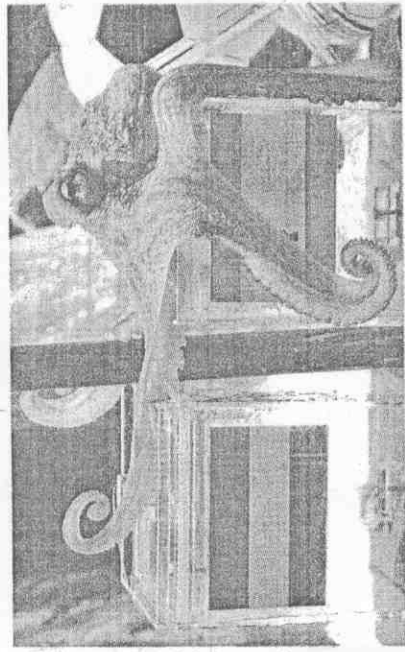
神算草魚哥無疑是本屆世界盃最紅的傳奇，目前已經7連勝，挑戰全勝戰績，就看今晨冠軍戰的結果。

4年一度的世界盃，短短一個月賽事吸引全球矚目，草魚哥預測功力也被凸顯放大，其實早在2年前歐洲盃，草魚哥就已「出道」，只不過比賽受變日程度不同，牠的「特異功能」足足晚了2年才讓廣大世人發現。