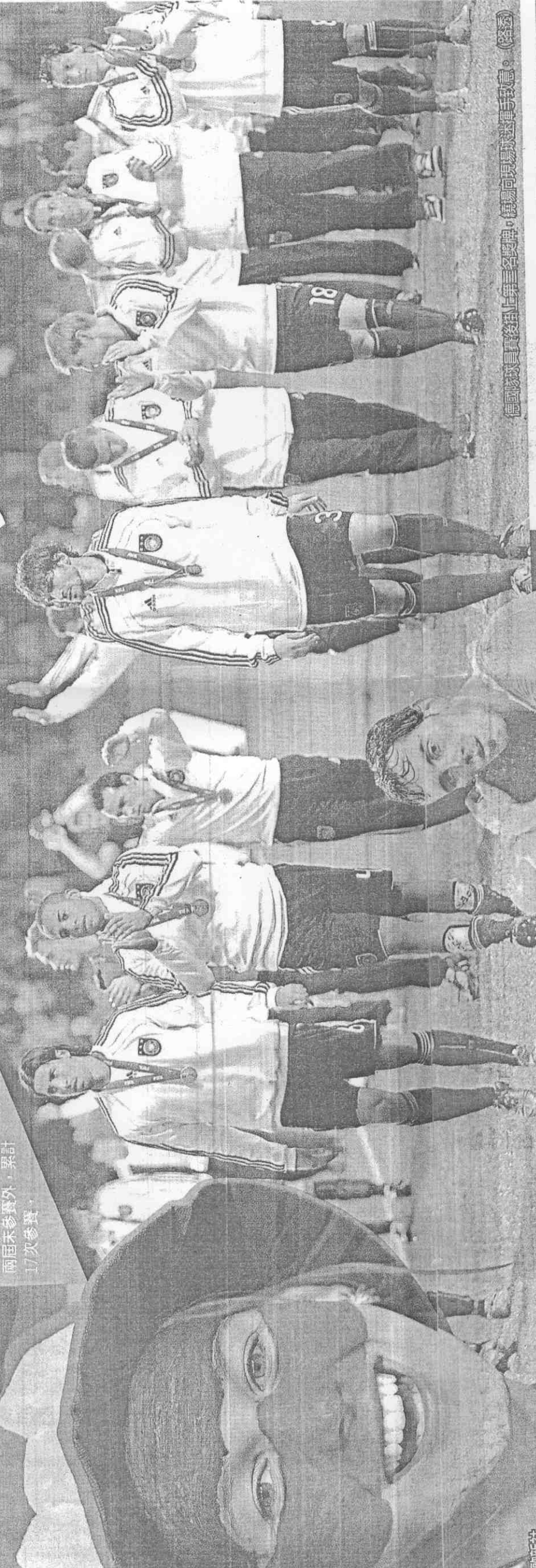
德國球員賽後登上第三名獎牌，隔場向現場球迷揮手致意。