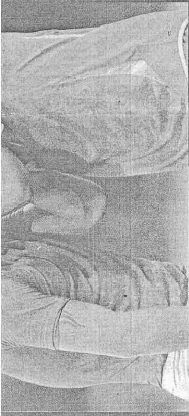
烏拉圭落敗後，併戰全場的主力前鋒蘇雷茲（左）難過地靠在隊友高丁肩膀上哭泣。

「7次預言7次命中，這對一隻2歲的草魚來說，似乎滿不賴的。」保羅的臉書上搞笑地寫著：「恭喜德國（我們又是朋友了嗎？）和烏拉圭，他們踢出了一場精彩比賽，佛蘭的表現很突出，運氣也夠好。」