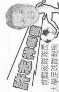
前國家隊隊長 前中興大學足球隊教練 評志悍硬