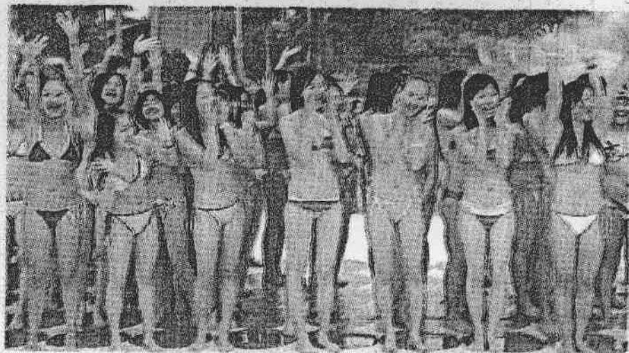
為表達廣州市民對2010年亞運會的期待，廣州的長隆水上樂園昨天舉辦了有1290名女士參加的“2010”數位比基尼造型活動，打破了去年在這裏創造的1202人的健力士世界紀錄。