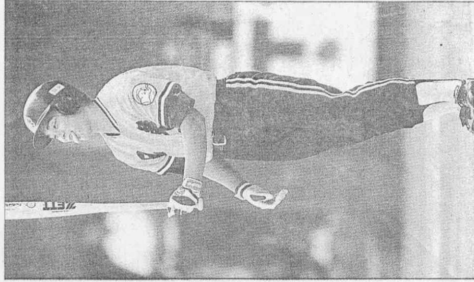
資料照片