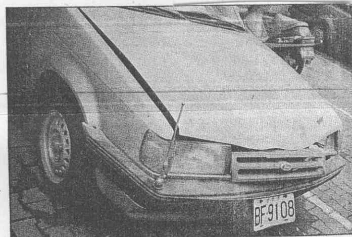
↑味全洋將艾勃墜樓後，摔在車號BF-9108福特全壘打車上，造成車頭引擎蓋凹陷。