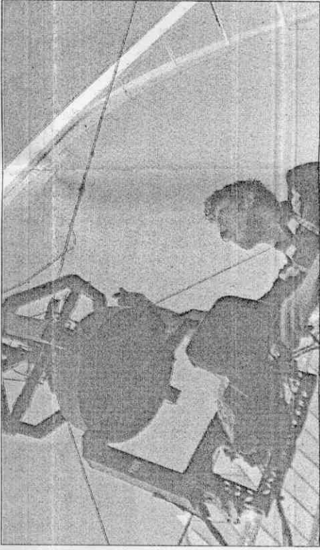
其實國際足總早有高科技攝影機可輔助判決，如今大家要求判決科學化，八強賽起應可全面使用這種蜘蛛攝影機。

10. 阿根廷盃 成績勝禁欲派 球員上場比賽，球員們的妻子或女友是否應該隨侍在側？阿根廷隊教練馬拉度納讓球員「盡性」，在場上「盡興」；英格蘭隊教頭卡佩羅則堅持「禁欲」，不准球員老婆或女友隨隊。以目前阿根廷晉8強，英格蘭隊16強止步的情況來看，「盡性」說似乎略占上風。