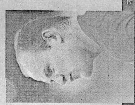
不服氣的人，請讀魯尼的唇，裁判們會說：「開頭囉。」

3. 各國裁判 先交流講話記誦 為了方便裁判正確判別是否有球員在比賽時「出口成讎」，國際足總在賽前發給裁判員11種語言的「講話表」，要裁