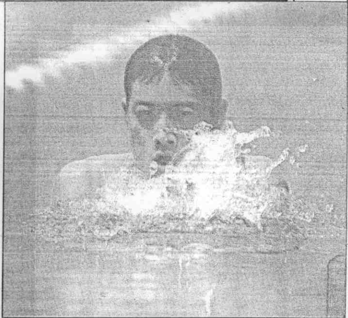
▲進前力奮中式蛙尺公百在嚴心蔡「小蛙王」 (攝岩少林 者記報本)