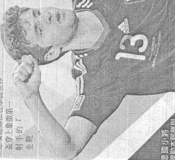
德國小將穆勒本屆雖與其他3人同樣攻進5球，但他以3次助攻力壓對手，搶下金靴獎，同時包辦最佳新人，成為本屆個人獎最大贏家。