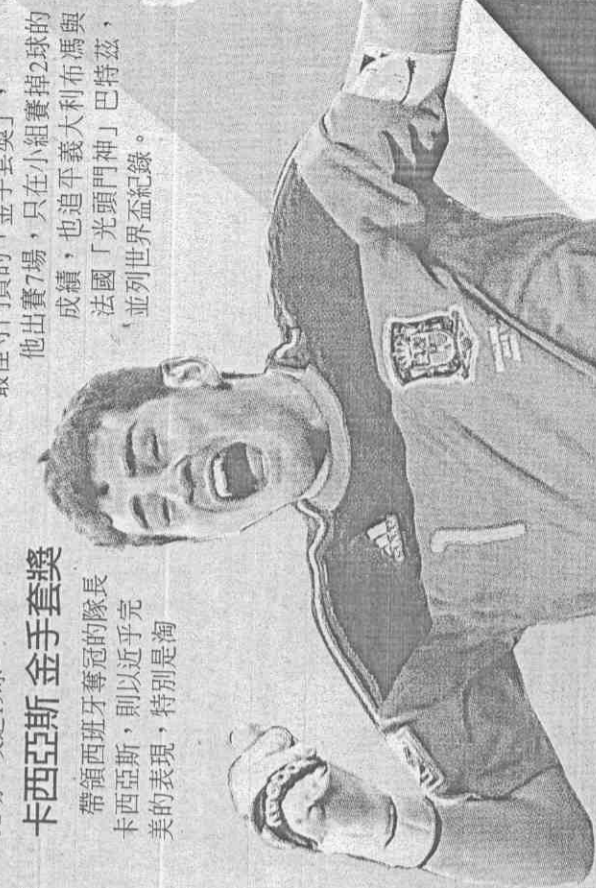
西班牙隊長卡西亞斯在本屆世界盃階段一球未失，不但帶領無敵隊奪冠，也讓他獲選「金手套獎」。