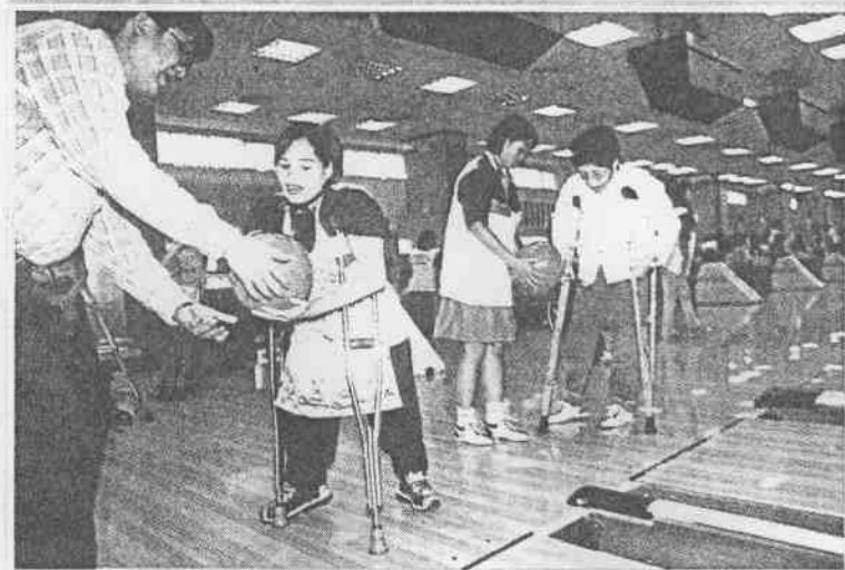
↑首開台灣纖維球道新紀元的聯合保齡球館，於上週末舉辦肢體障礙者保齡球賽，讓殘障球友來「鮮嘗」。