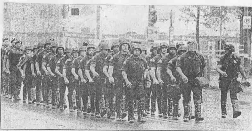
↑爆炸案後，安全措施已經加強，武裝部隊在街頭行進。←美國菸酒槍械管理局幹員二十七日在亞特蘭大奧林匹克公園搜索證據，一名幹員趴著檢視炸彈爆炸後留下的一處凹坑。