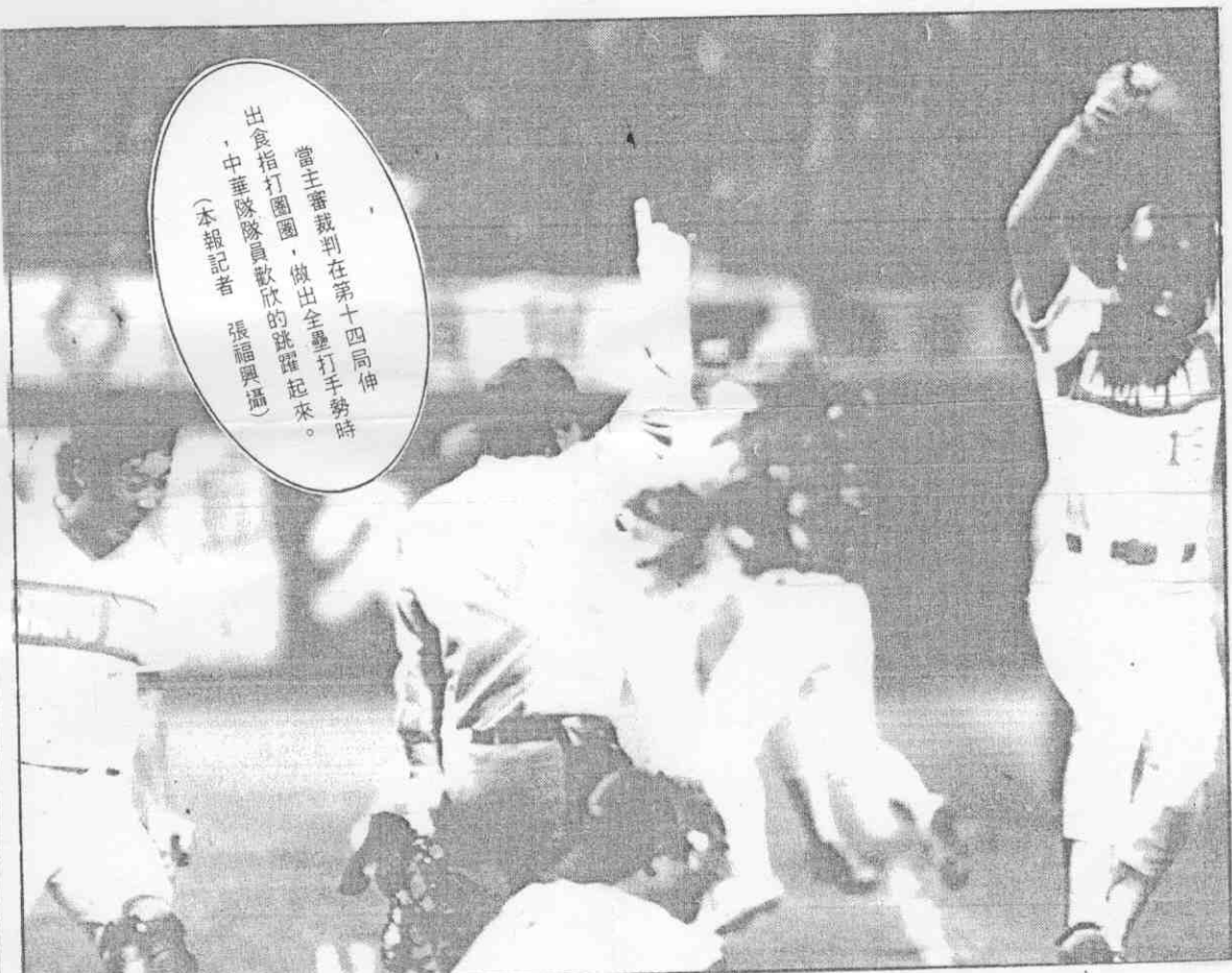
當主審裁判在第十四局揮出全壘打，做出全壘打手勢時，中華隊隊員歡欣的跳躍起來。