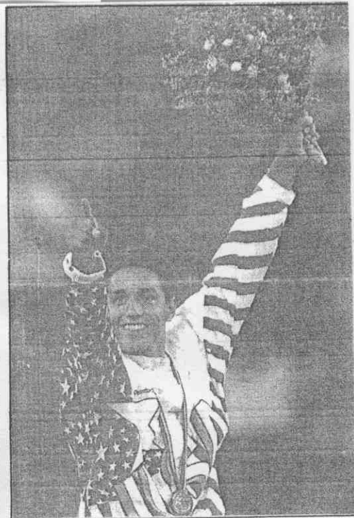
←獨立國協體操好手薛波所向披靡，這是他贏得鞍馬金牌的演出。法新社／傳真