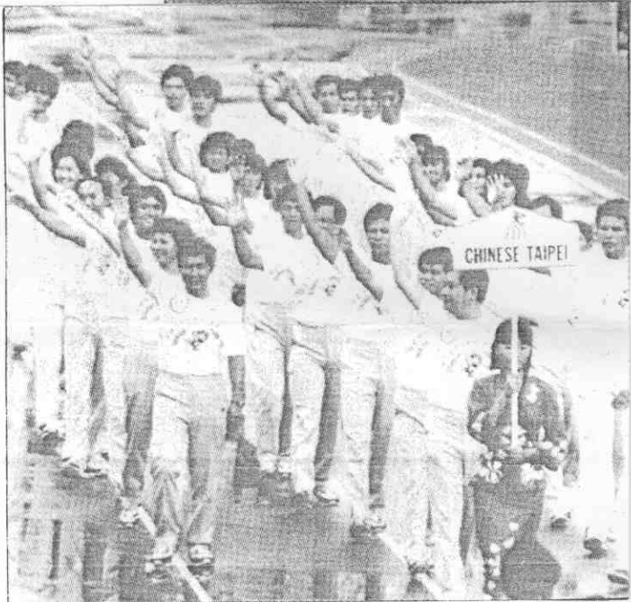
亞洲田徑錦標賽昨天下午在新加坡國家體育場揭幕，中華隊進場。