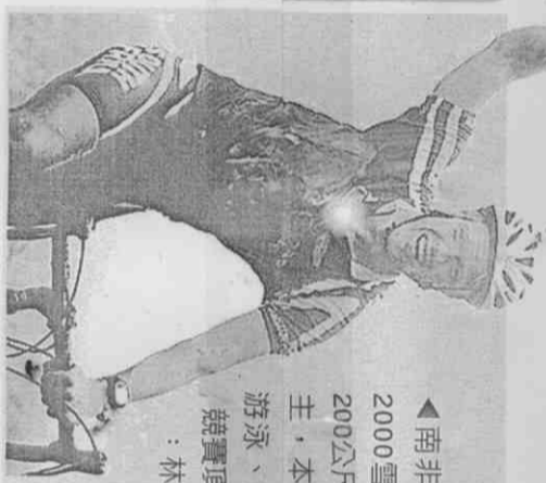
▲南非選手帕金是2000雪梨奧運男子200公尺蛙式銀牌得主，本屆聽奧角逐游泳、自由車兩種競賽項目。